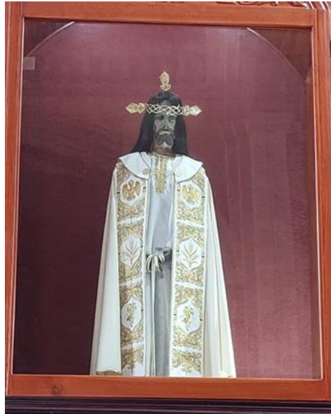
Figura 2. Cristo Preso, Señor de Tabasco.