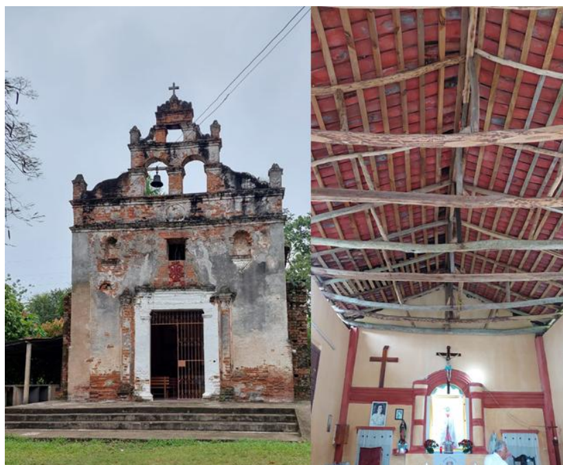
Figura 1. Exterior e interior de la Iglesia de Mirandillas, Cunduacán Tabasco.