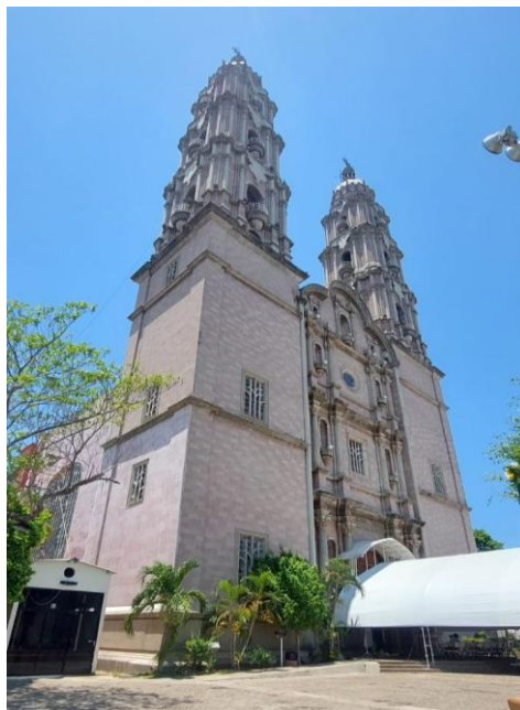
Figura 3. Actual Catedral del Señor de Tabasco.