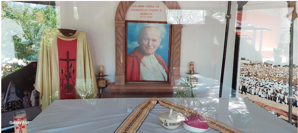
Figura 4. Capilla de San Juan Pablo II.