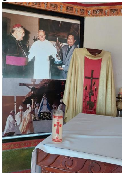
Figura 5. Imágenes de San Juan Pablo II en su visita a Tabasco.