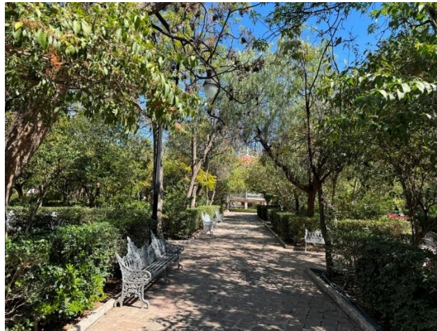
Figura. Jardín de San Marcos

fue reiteradamente reconocida por la prensa local. En este sentido, la perseverancia de la población sanmarqueña frente a guerras, epidemias y crisis políticas reforzó la imagen del barrio como espacio resiliente y creativo, capaz de sostener una tradición festiva de alcance nacional.