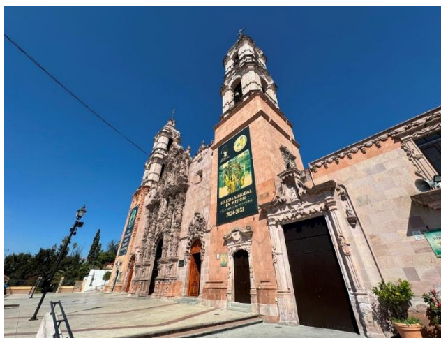
Figura 6. Santuario de Guadalupe