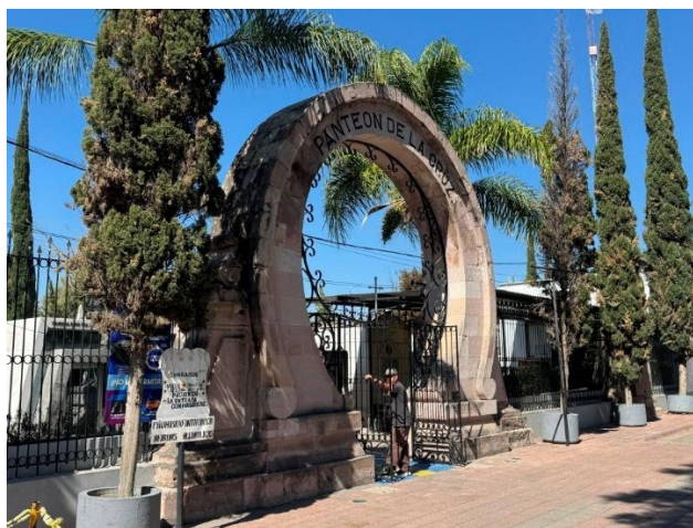
Figura 7. Panteón de La Cruz

Por otro lado, los panteones de los Ángeles y de la Cruz (figura 7) constituyen un conjunto funerario de alto valor histórico, artístico y simbólico. La presencia de monumentos catalogados por el Instituto Nacional de Antropología e Historia (INAH), así como las prácticas culturales contemporáneas asociadas a recorridos de mitos y leyendas y a la Feria de las Calaveras, evidencian un resignificado de estos espacios como escenarios de memoria colectiva y de turismo. En torno a ellos, la persistencia de florerías y marmolerías familiares refuerza la continuidad de oficios artesanales que han pasado de generación en generación, integrándose al paisaje citadino como expresiones vivas del patrimonio inmaterial.