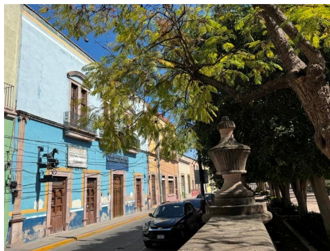
Figura 5. Casonas alrededor del jardín

confirma el papel del barrio como semillero de creadores y como espacio donde la artesanía trasciende su dimensión utilitaria para convertirse en expresión artística de alcance nacional.