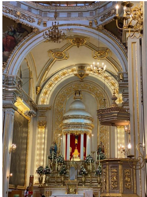
Figura 9. Cristo del templo del Señor del Encino

De manera paralela, la relativa distancia del asentamiento respecto al centro de la traza le otorgó un carácter de autosuficiencia y autonomía social. Aunque se le asoció con población de origen español dedicada al cultivo de chile, vid y hortalizas, la fuerza laboral estuvo integrada mayoritariamente por población mulata y afrodescendiente, cuya presencia dejó una huella profunda en las prácticas culturales y religiosas del lugar. Este mestizaje social se expresa de forma elocuente en la veneración al Cristo Negro del Señor del Encino (González, 2018: 189), imagen cuya devoción se consolidó desde el siglo XVIII (figura 9) y que ha sido vinculada tanto a la actividad minera como a la Tercera Raíz cultural africana en Aguascalientes.