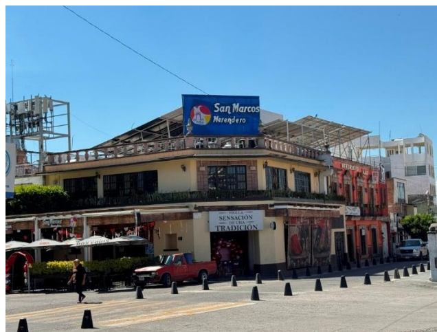
Figura 3. Merendero San Marcos