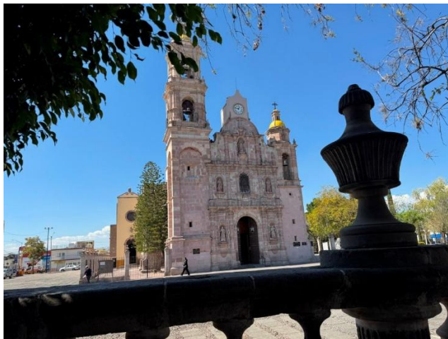
Figura 1. Templo de San Marcos desde el jardín