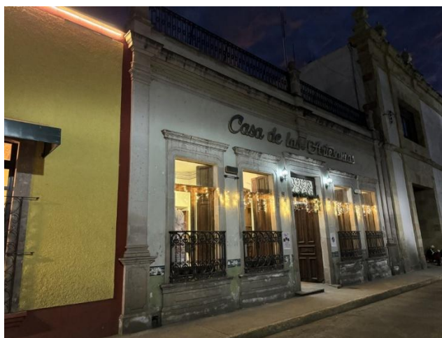
Figura 4. Casa de las Artesanías

Asimismo, la tradición taurina, materializada en la Plaza de Toros San Marcos, la Plaza Monumental de Aguascalientes, el Palenque y el Casino de la Feria, constituye otro eje fundamental de la identidad barrial. Estas fincas del espectáculo reflejan distintas etapas del desarrollo urbano y tecnológico, desde cosos provisionales de madera hasta complejos enormes de concreto armado con referentes moriscos y modernos. Más allá de la lidia, estos recintos han albergado conciertos, exposiciones y eventos sociales, ampliando su función como espacios culturales multifuncionales y como atractivos turísticos de gran escala. En paralelo, la presencia de instituciones educativas y culturales como el Centro de Estudios Musicales Manuel M. Ponce, la Casa de las Artesanías (figura 4) y el Colegio Portugal refuerza la vocación del barrio como enclave de formación artística y preservación patrimonial.