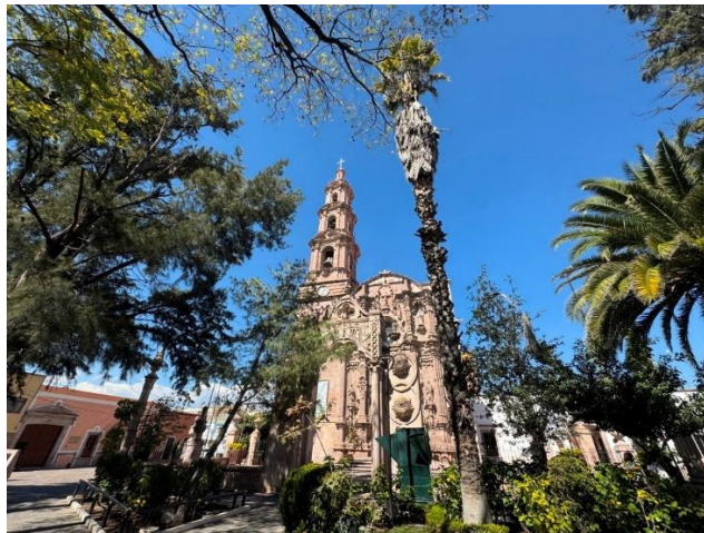
Figura 10. Templo del Señor del Encino desde el jardín

de 1796, se efectuó la bendición del nuevo templo del Señor del Encino, realizándola el señor cura Br. Dn. Miguel Martínez de los Ríos...” (Chávez, 2010: 78), alzándose el inmueble como una de las expresiones más relevantes del barroco tardío en la región. Su portada ultra barroca, el uso del estípite, la integración escultórica y el programa iconográfico pasionario reflejan no solo una alta calidad artística, sino también la participación de la comunidad en su financiamiento y ornamentación, mediante limosnas, obras pías y donaciones testamentarias. Asimismo, el Viacrucis monumental pintado por Andrés López, considerado por Alfonso Pérez Romo como un prodigio de integración arquitectónica y artística (figura 10), refuerza el valor patrimonial del templo como espacio de cohesión social y atractivo cultural según refiere Gutiérrez (2003: 360).