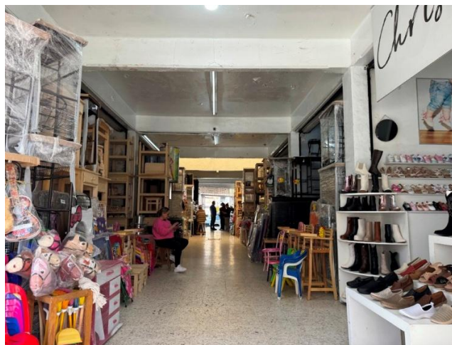
Figura 8. Mercado Juárez y sus artesanías

consolidan a Guadalupe como un enclave donde la arquitectura funcional y la producción artesanal continúan siendo pilares de identidad y atractivo turístico.