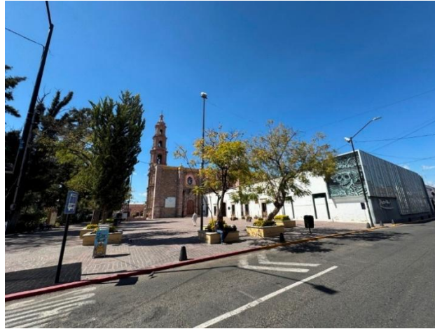
Figura 11. Museo José Guadalupe Posada